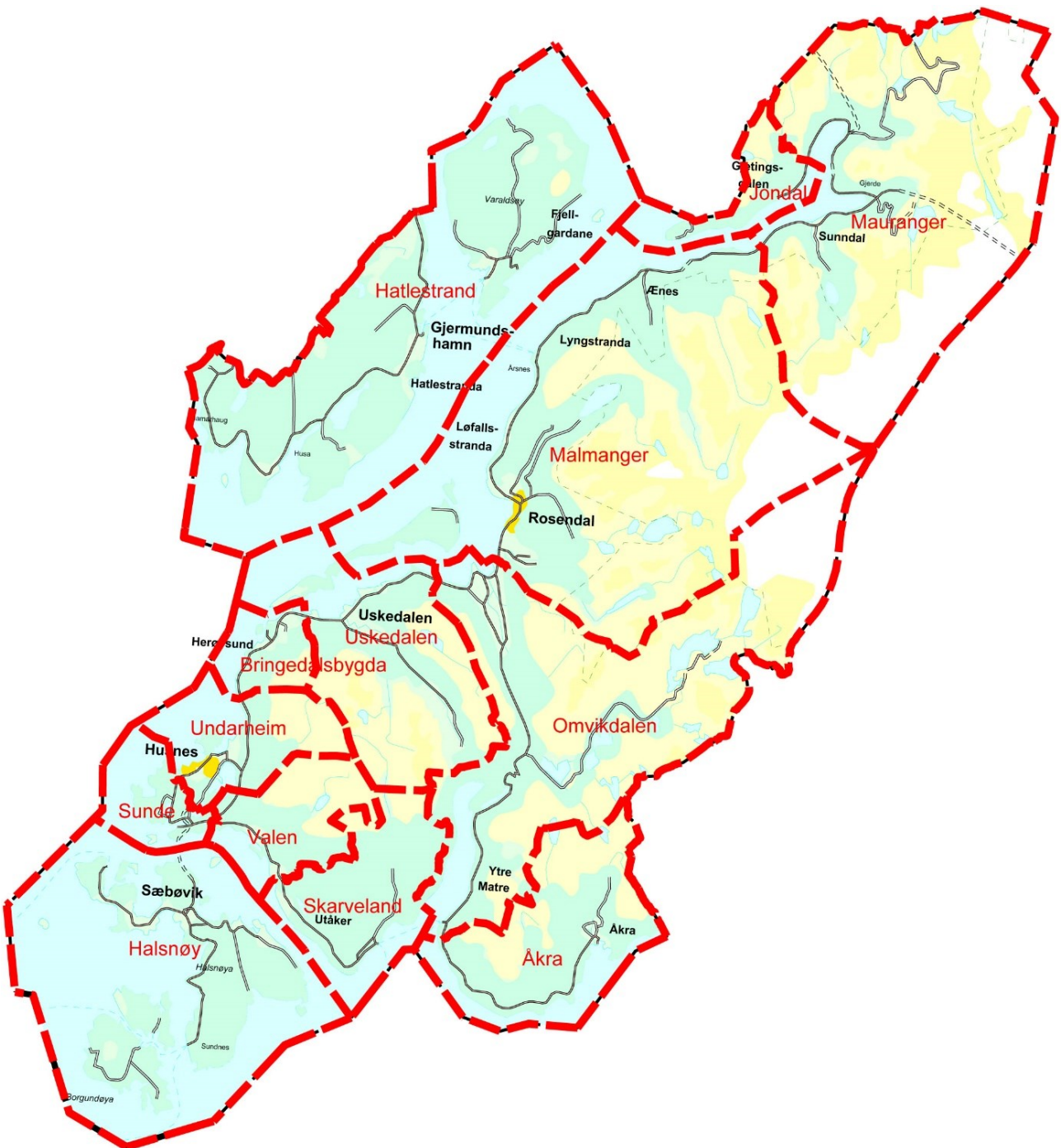
Figur 1: Baneskulekrinsar