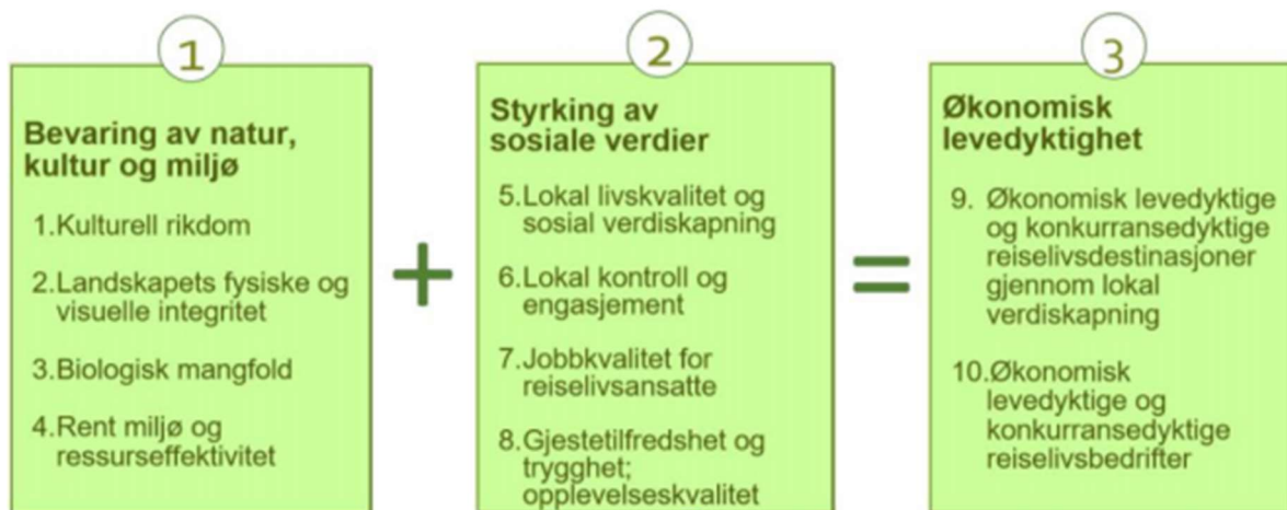
FN sine 10 prinsipper for bærekraftig utvikling av reiselivet