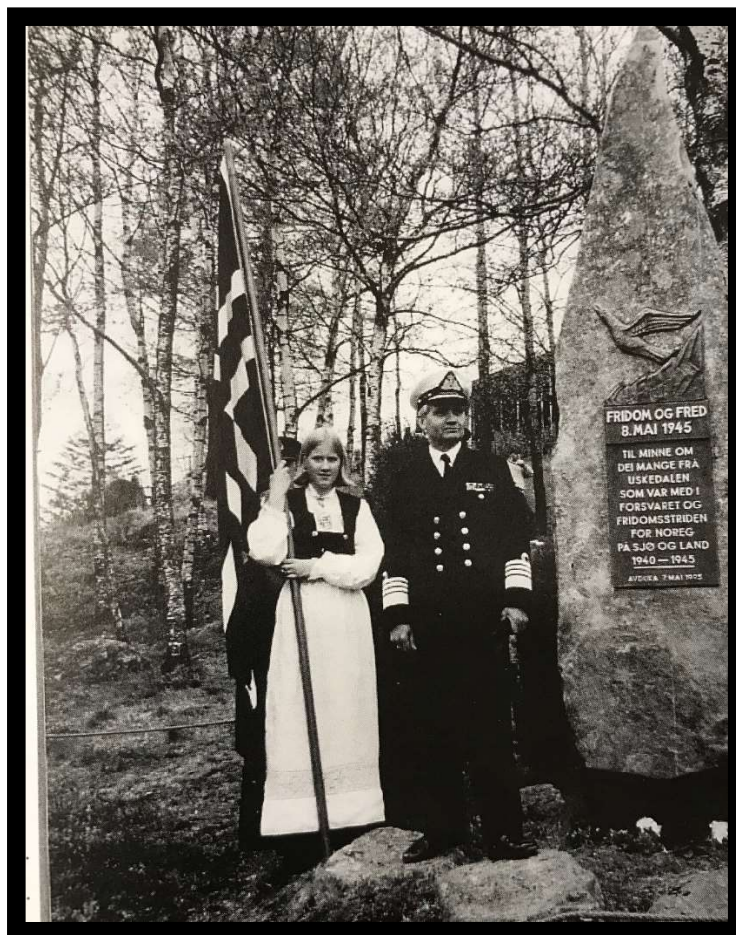
*Minnemarkering Uskedalen 1995