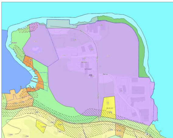
Figur 3 Utsnitt gjeldande kommuneplan Føremål