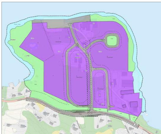
Figur 4 Eksisterande reguleringsplan

Store deler av planområdet er omfatta av reguleringsplan frå 1978 og er regulert til næring, kai, park og infrastruktur/samferdsel. For deler av området, overstyrer kommuneplanen arealbruken ved at det er avsett areal til naust, fritidsføremål og bustad. Dette i tillegg til føremåla i reguleringsplan frå 1978.