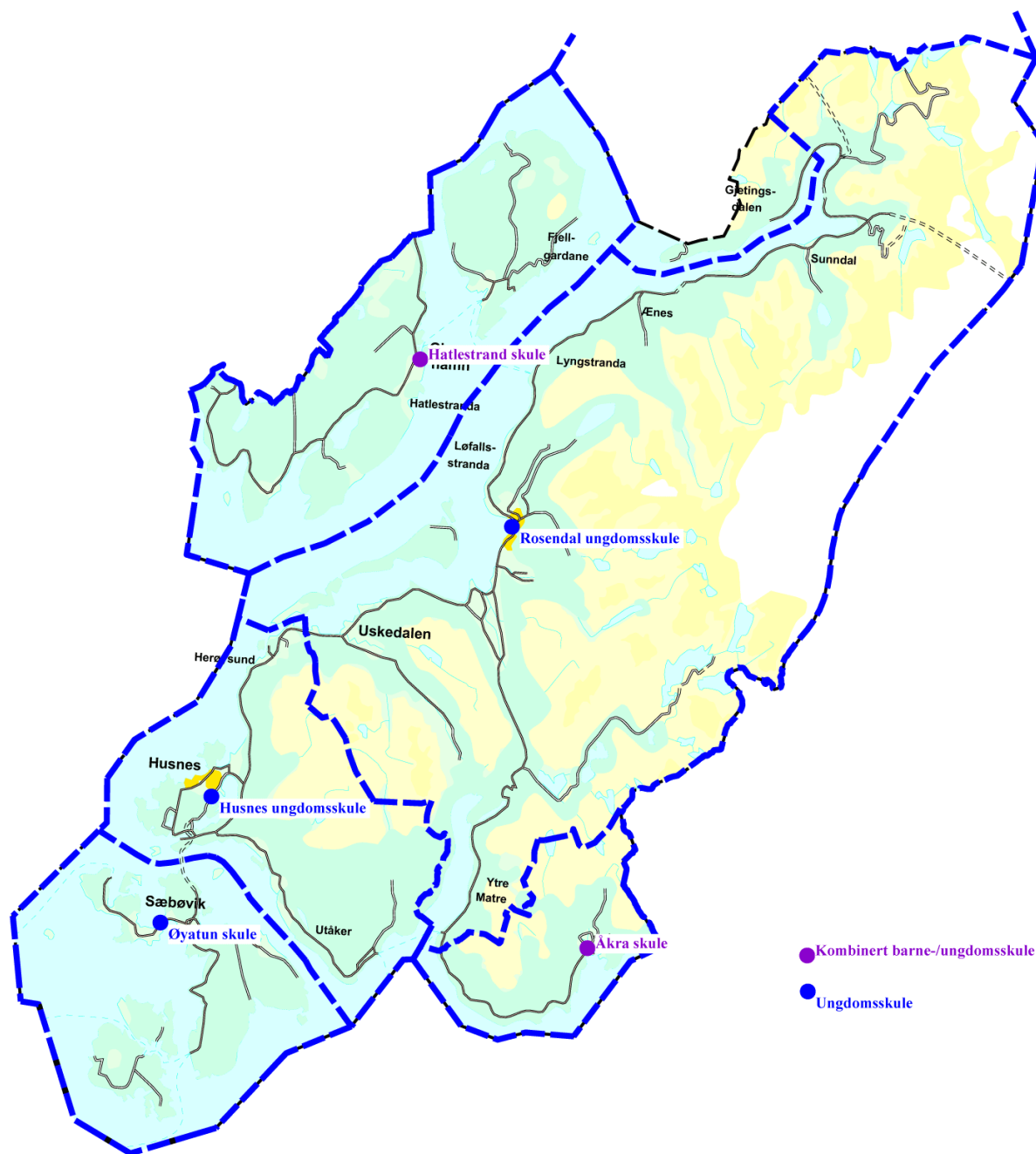
Figur 2: Ungdomsskulekrinsar